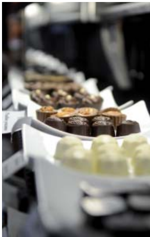
Des produits qui feront la joie des gourmands