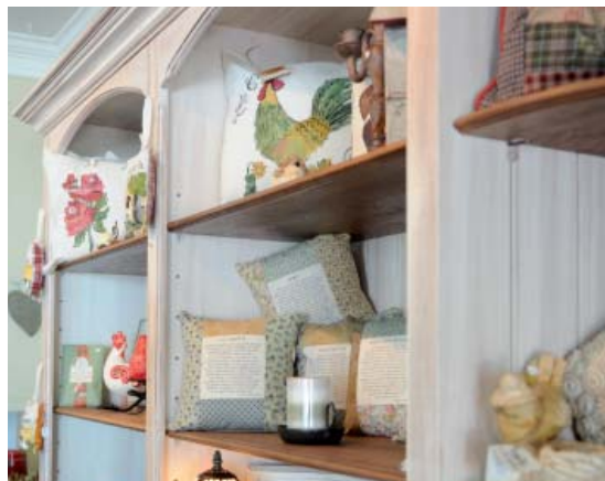
Des idées pour les cadeaux et la décoration

L'un des traits distinctifs de L'Authentique Décor est certainement la grande place réservée aux produits artisanaux locaux, d'ici comme d'ailleurs au Québec, d'où le caractère résolument exclusif de plusieurs des produits offerts dans la boutique.